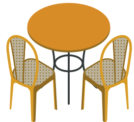
Rotin et imitation