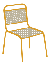
Rotin/Osier (naturel ou synthétique)