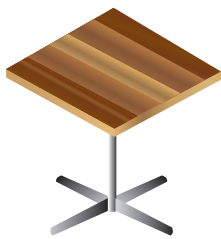
Bois stratifié de mauvaise qualité