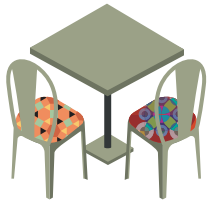
Coussins et garnitures dépareillés