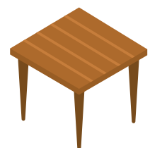
Bois ou stratifié de qualité