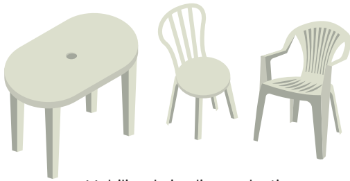
Mobilier de jardin en plastique