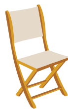
Toile (naturelle ou synthétique)